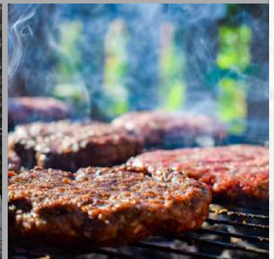
TYPISCH SA GRILL